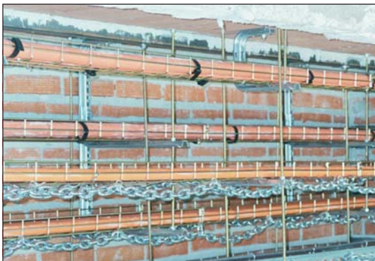
Figura 1. Vista general del montaje