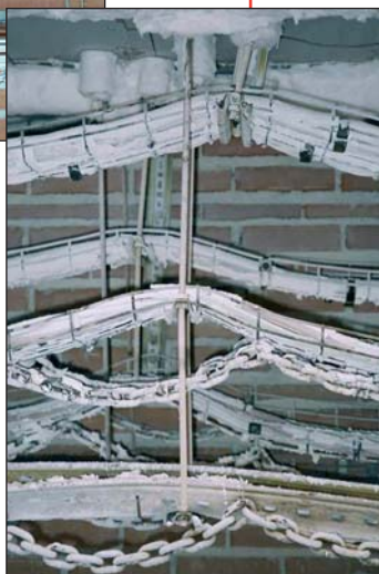
Figura 3. Estado final tras el ensayo